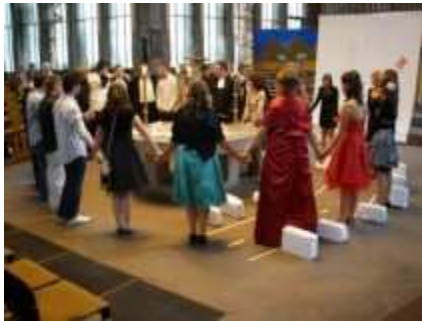
Irischer Reisesegen für die 10 b