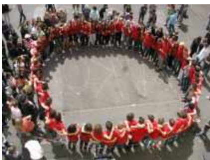
10 a und 10b - AK09