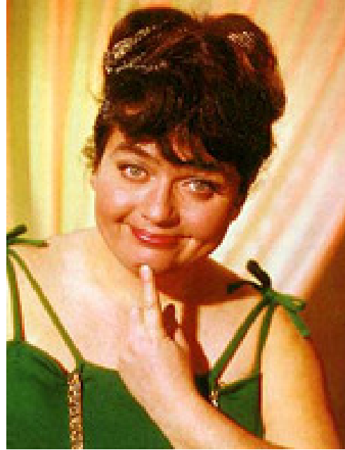
Trude Herr * 4. Mai 1927 † 16. März 1991 Kölner Sängerin & Schauspielerin

Ob söß oder better, Du muß überlä- ve, jot oder schläch, et is ming Stadt.